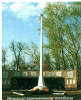
Мемориал верещагинцам, погибшим в годы Великой Отечественной войны

Верецагинский район - родина многих известных людей. В селе Путино родился видный общественный и политический деятель, предприниматель и издатель П.И. Макушин (1844-1926). В д. Старый посад - известный в Пермском крае историк и краевед Ф.А. Волегов (1790 - 1826). В поселке Зюкайка - член Союза художников СССР (1977 г.) А.Г. Филимонов (1949-2002), в Верецагино - Заслуженный художник РСФСР (1976) С.А. Серебрянников (р. в 1919 г.). Здесь прошли детские и школьные годы рекордсменки мира по парашютному спорту 30-х г. Т.А. Куталовой (1914-1957).