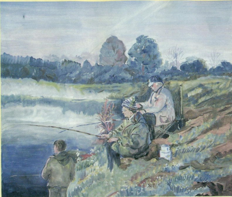
На р.Обве, Карагайский р-н. М.