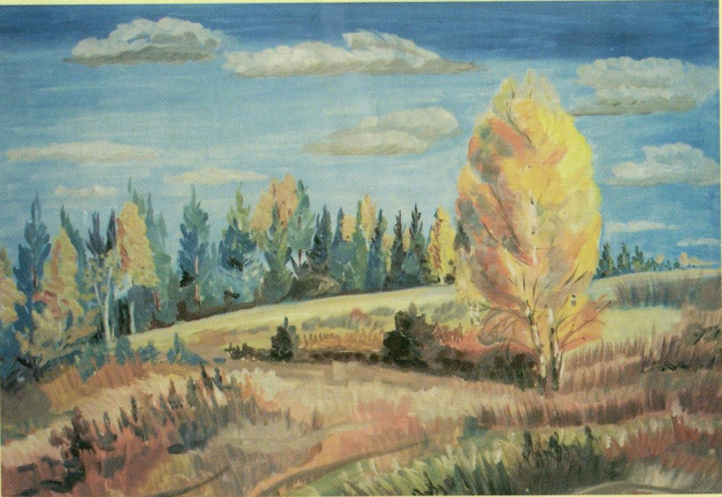
Осень, д.Ромашино, Сивинский р-н. М.