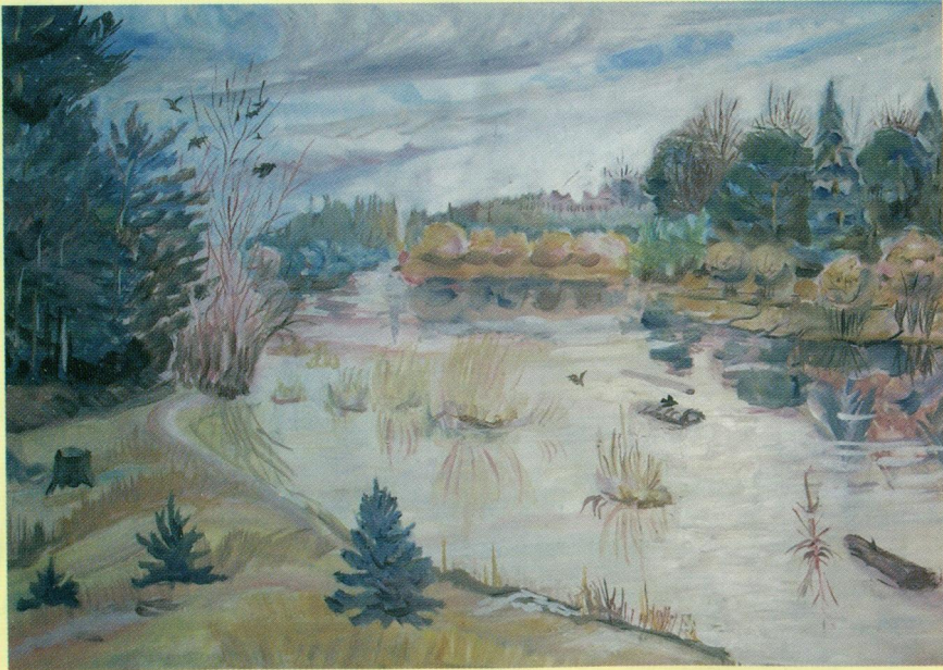
Весна на р.Обве. Карагайский р-н. М.