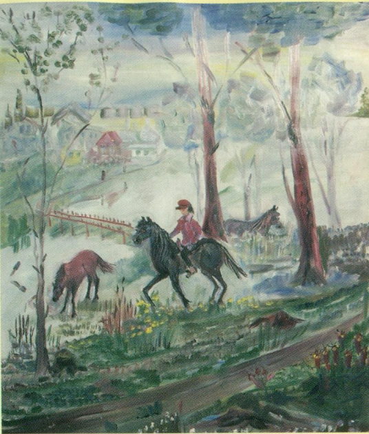
Раннее утро. М.