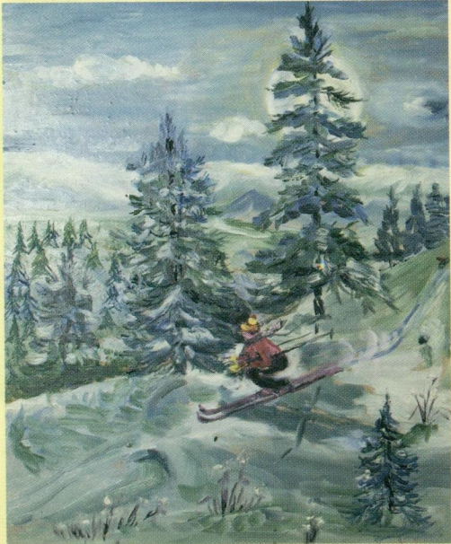
На прогулке. М.