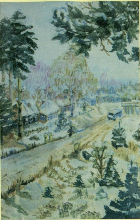
Окраина п.Зюкайки. М.