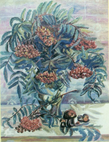
Рябина красная. Натюрморт. М.