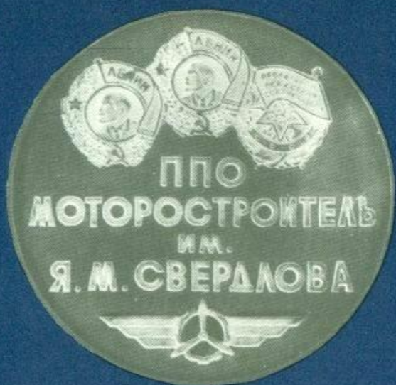
Медаль 144. Реверс.