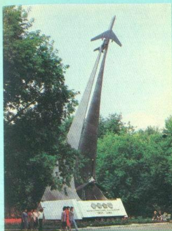
Памятник пермским моторостроителям.