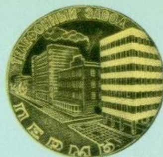
Медаль 156. Реверс.

тябрьской Революции и ордена Трудового Красного Знамени, которыми награждено предприятие. В центре аверса медали выпуска 1984 года надпись: «45 лет» и лавровая ветвь. На реверсе — марка предприятия и его название.