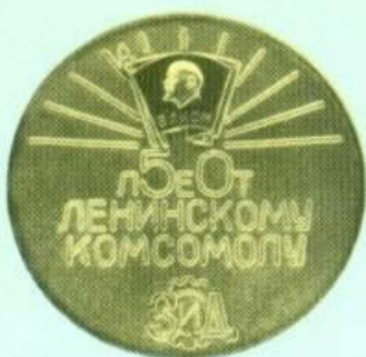
Медаль 14. Реверс.

съезда КПСС от Пермской областной партийной организации».