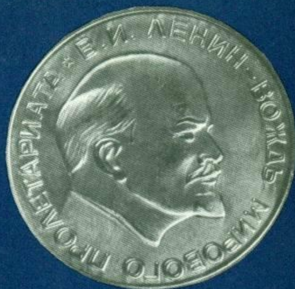
Медаль 20. Аверс.

Первая пермская медаль с портретом Владимира Ильича появилась в ознаменование 100-летия со дня рождения В. И. Ленина. На лицевой стороне медали (аверсе) — профильное изображение основателя Коммунисти-