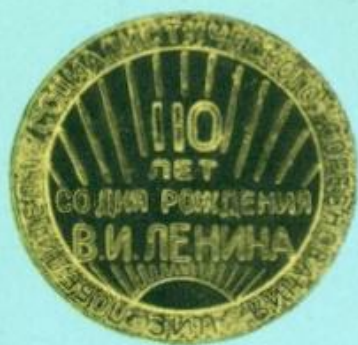
Медаль 94. Реверс.

ческой партии и Советского государства. По окружности надпись: «В. И. Ленин — вождь мирового пролетариата». На оборотной стороне медали (реверсе) — даты: 1870—1970.