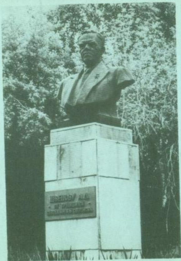
Памятник А. Д. Швецову в Перми.