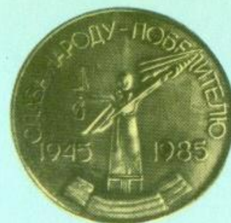
Медаль 153. Аверс.

ликой Отечественной войне. К этой знаменательной дате предприятия Перми изготовили несколько юбилейных медалей. Они явились продолжением темы героики военных лет и посвящаются всем тем, кто сражался на фронтах в годы Великой Отечественной войны, кто самоотверженно трудился в тылу, кто отстоял свободу и независимость нашей Родины.