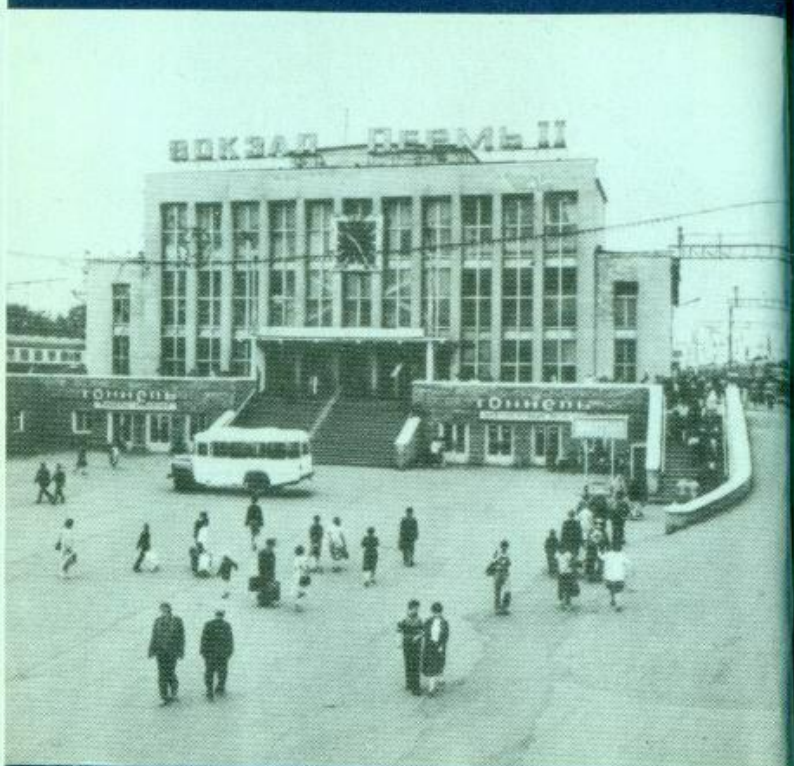
Пермский железнодорожный вокзал.