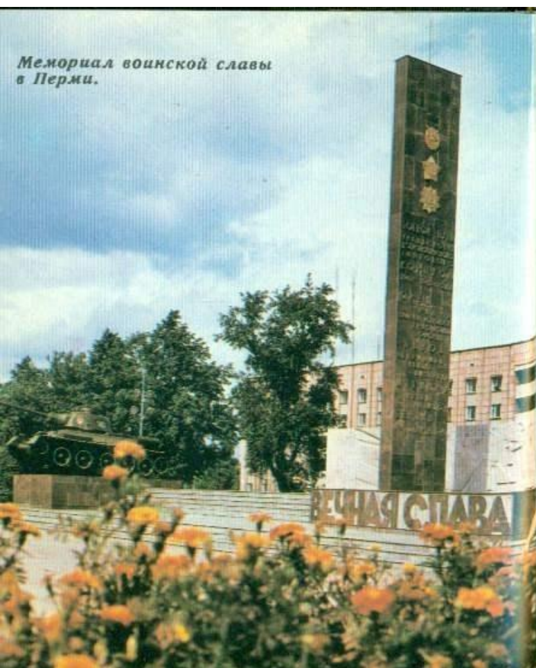
Мемориал воинской славы в Перми.

улице Карла Маркса в Перми. Каждый год в День Победы собираются сюда люди, чтоб почтить память тех, кто отдал жизнь за будущее Советской страны, и воздать почести ветеранам.