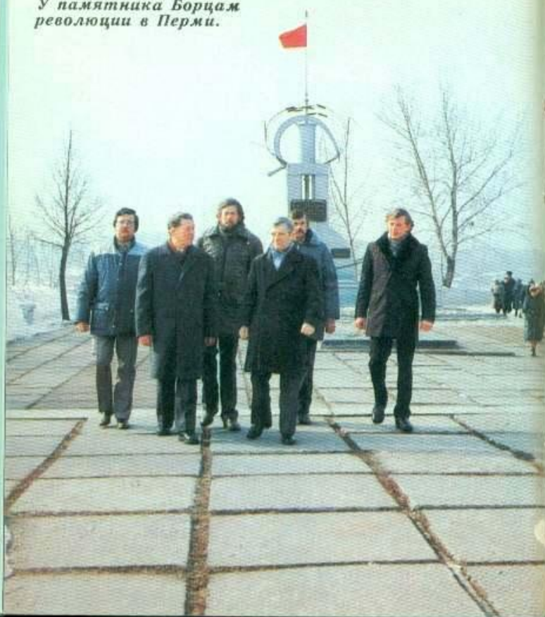
У памятника Борцам революции в Перми.

Красного Знамени. В 1921 году работал председателем Пермской губернской ЧК.