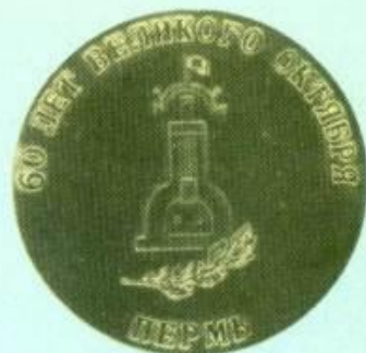
Медаль 67. Реверс.

На пермском машиностроительном заводе имени В. И. Ленина, известном своими трудовыми и революционными традициями, в 1983 году выпущена медаль, посвященная 80-летию II съезда РСДРП. На аверсе медали изображен Владимир Ильич Ленин.