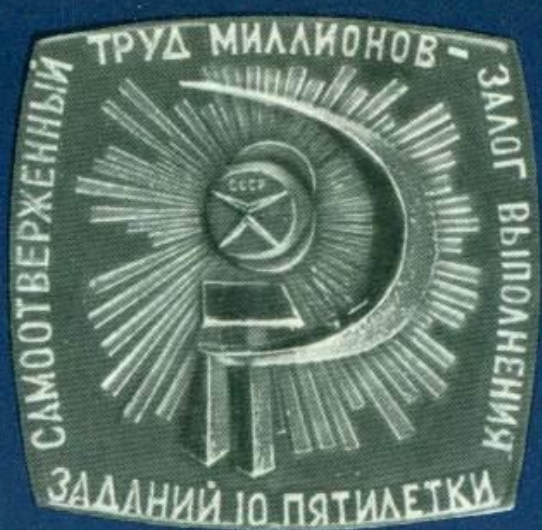
Плакета 100. Реверс.

ник Борцам революции и надпись: «г. Пермь».