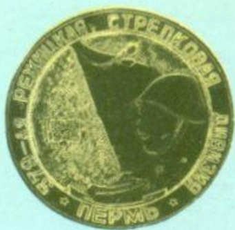
Медаль 102. Аверс.

Тогда, в июне 1941 года, более половины выпускников института ушли на фронт. Многие не вернулись с войны. За мужество и героизм, проявленные в боях Великой Отечественной, и за доблестный труд в тылу молодые врачи были награждены орденами и медалями.