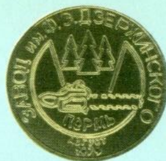
Медаль 92. Реверс.

В 1984 году исполнилось 50 лет четырежды орденосному пермскому объединению «Моторостроитель» имени Я. М. Свердлова.