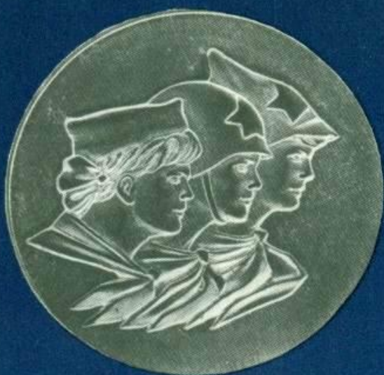
Медаль 28. Реверс.

се медали — памятник Борцам революции, надпись и дата: «Пермь 1982». Медаль вручалась ветеранам партии и комсомола, комсомольцам-активистам.