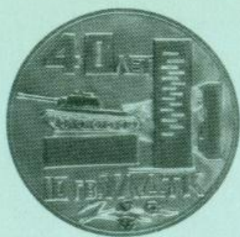
Медаль 132. Аверс.

ского танкового корпуса. На аверсе медали изображен архитектурный ансамбль в честь воинов-танкистов и надпись: «40 лет гв. УЛДТК» 1 . На ре-