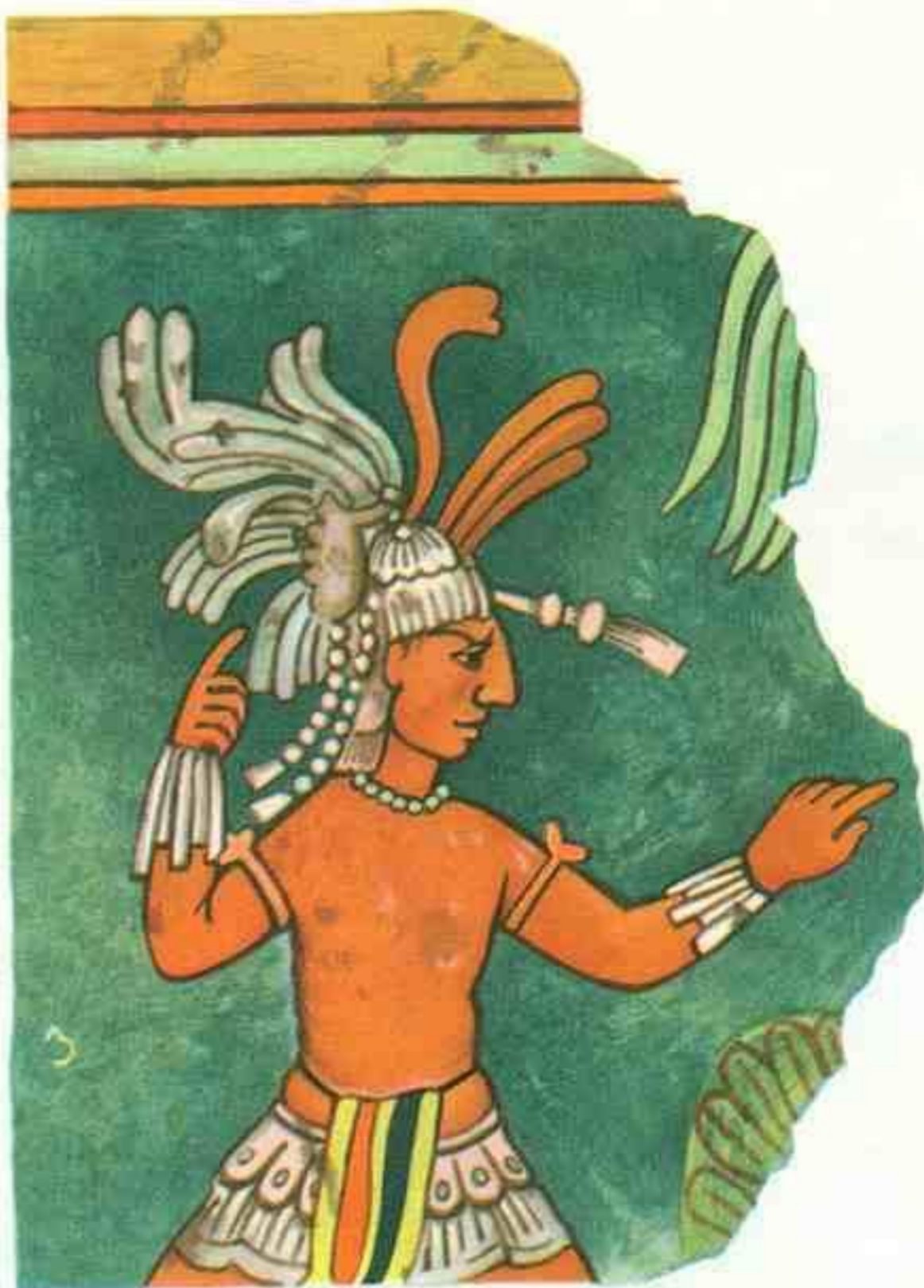
Древняя Мексика. Роспись в Бонампаке

Вместе эти два знака понимаются как «слушай».