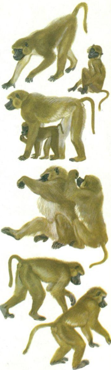
БАБУИНЫ — дальние родственники человека. Они живут группами и часто охотятся сообща.

Когда люди изобрели слова, они сразу почувствовали, насколько им стало легче и лучше жить. Словами они могли говорить о друзьях, которые были далеко от них, могли потолковать с друзьями о чем-то, что они делали когда-то сообща. При помощи слов они могли вместе вспоминать о прошлом и строить важные планы на будущее. Слова помогали людям объединяться в большие племена. Благодаря словам люди могли обмениваться разными сведениями, у них стало появляться много новых мыслей. А чем больше у людей появлялось новых мыслей, тем быстрее они возникали снова и снова.