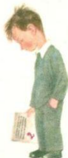
НЕ ВЕШАЙ НОС