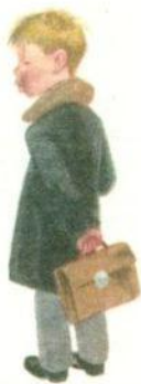
ЧТО ГУБЫ НАДУЛ?