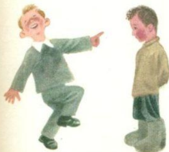
НА ТЕБЯ БУДУТ ПАЛЬЦЕМ ПОКАЗЫВАТЬ