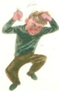
ОН РВЕТ НА СЕБЕ ВОЛОСЫ