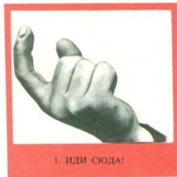
1. ИДИ СЮДА!

РАЗГОВОР ПРИ ПОМОЩИ ЖЕСТОВ. Люди в наше время объясняют многое при помощи рук, совсем как их далекие предки. Вот несколько жестов, которыми вы часто пользуетесь. В других странах некоторые из этих жестов тоже применяются. У многих народов есть свои собственные жесты.