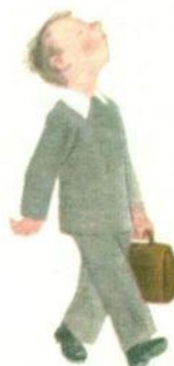
ОН ЗАДИРАЕТ НОС