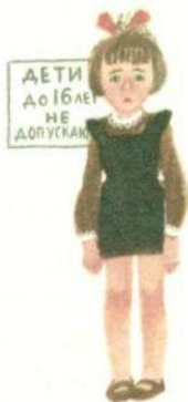
У НЕЕ ВЫТЯНУЛАСЬ ФИЗИОНОМИЯ